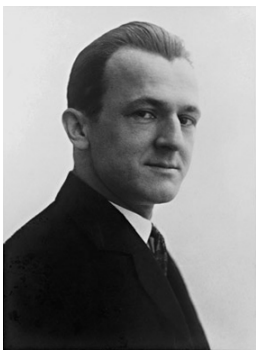
GEORGES GROSZ (1893-1959)

Peintre et caricaturiste, il est membre actif du mouvement Dada et de l'aile gauche de la « Nouvelle Objectivité ». Il combat pendant la 1 ère Guerre Mondiale. En 1919, il adhère au Parti Communiste Allemand, se sert de l'art pour décrire la réalité du monde et dénonce les excès des différents pouvoirs, l'armée, les bourgeois, la religion. Visionnaire, il ne cesse d'alerter ses contemporains de l'imminence de l'arrivée des nazis et finit par quitter