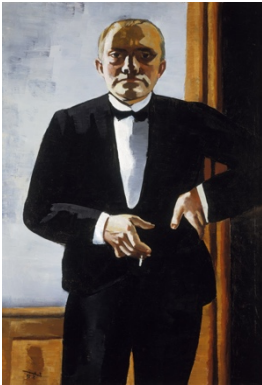
MAX BECKMANN (1884-1950)

Né à Leipzig, il est d'abord fasciné par les impressionnistes et la Renaissance. Au début de la 1 ère Guerre Mondiale, il est infirmier et est démobilisé dès 1915 pour cause de dépression nerveuse. C'est un observateur aigu de la crise sociale et morale des années 20. Il peint des visages émaciés, aux contours masqués. Il pratique une peinture dite subversive. À la suite de l'exposition sur les « arts dégénérés » organisée par les nazis, il quitte l'Allemagne pour les États-Unis.