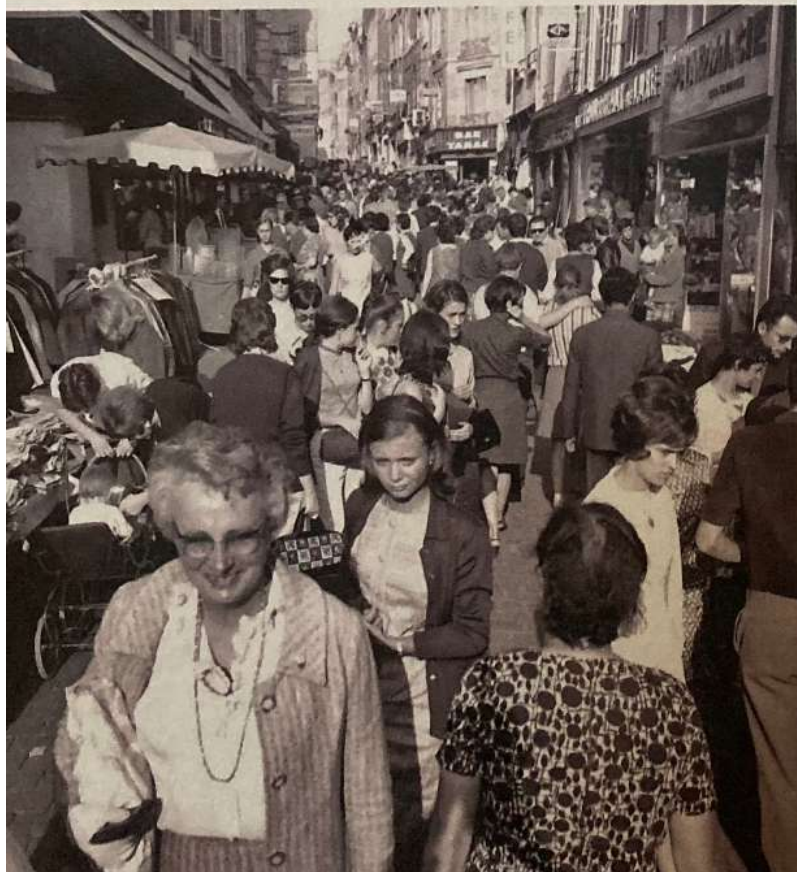
Braderie rue de Bourgogne, à Orléans, en juillet 1968.

Une pièce de théâtre interroge cet épisode dramatique de 1969. Un curieux rappel de l'histoire alors que, depuis le déclenchement de la guerre Israël-Hamas, plusieurs actes antijuifs ont été constatés en France. Texte Ondine DEBRÉ